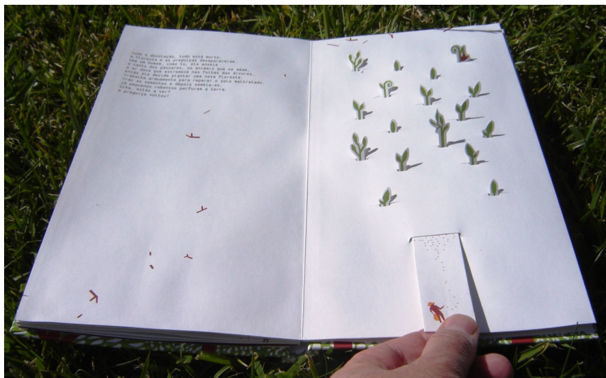
Imagen 8. En el bosque del perezoso , sexta doble página

Después del caos, resurge la esperanza y la narrativa presenta la recuperación de la armonía inicial: “Viene un hombre. Como tú, desea oír el canto de los pájaros, ver los animales que se aman y el aire dulce que tiembla en las hojas de los árboles”. Entonces, “decide plantar un nuevo bosque”, con arduo trabajo y semillas (imagen 8). Y de nuevo los árboles habitan la tierra, y con ellos vienen el perezoso, los otros animales y el hombre.