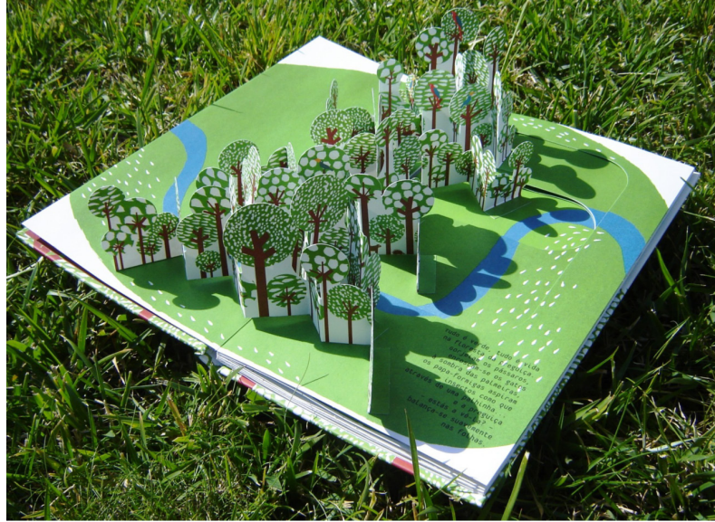
Imagen 6. En el bosque del perezoso , tercera doble página