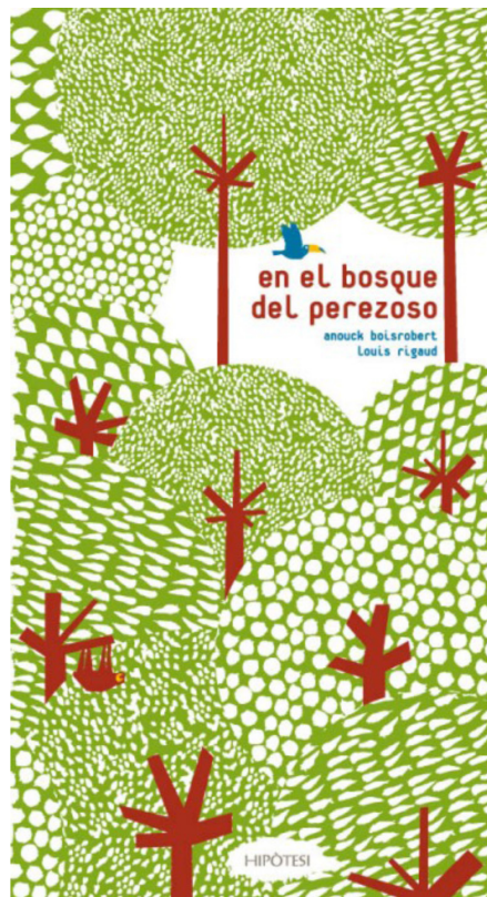
Imagen 4. En el bosque del perezoso , portada

Como se ha dicho antes, comparte con la obra anteriormente analizada, Popville , el hecho de ser un elaborado libro pop-up , pero difiere en la característica de tener texto en cada doble página.