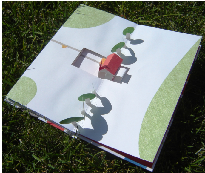
Imagen 1. Popville , primera página doble

Los espacios verdes, a su vez, disminuyen al mismo ritmo de expandirse la ciudad, y son rápidamente sustituidos por construcciones, ilustrando así la creciente ocupación de los ecosistemas naturales por el hombre. Al final, poco “verde” resta y el hormigón, aunque a veces muy colorido, domina todo el espacio disponible (imágenes 1 a 3).