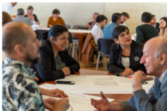
Espaços de trabalho para representantes da Redplanes.