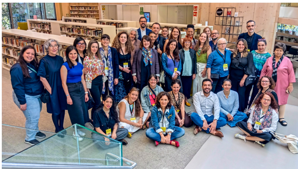
Pessoas assistentes da Sirbi na Biblioteca Gabriel García Márquez em Madrid

Em outubro de 2024, foi realizado o II Encontro Ibero-Americano do SIRBI, de 6 a 9 desse mesmo mês, em Barcelona, Espanha. Organizado pelo Cerlalc com o apoio do Ministério da Cultura da Espanha e do Consórcio de Bibliotecas de Barcelona, este evento, sob o lema “Ação bibliotecária pela equidade e justiça”, consolidou-se como um espaço fundamental para promover a ação bibliotecária voltada para a justiça social. Reuniu dezessete pessoas que lideram as redes e sistemas de bibliotecas de doze países ibero-americanos, que compartilharam experiências e trabalharam juntas para desenhar estratégias para contribuir, desde os sistemas de bibliotecas, para a inclusão e exercício dos direitos de todas as pessoas, sem exceção. A participação de um número significativo de delegados dos países foi possível graças ao trabalho de gestão do Cerlalc com os ministérios da Cultura e da Educação da região e ao esquema de aliança que permitiu reunir recursos técnicos e financeiros para a realização do encontro.