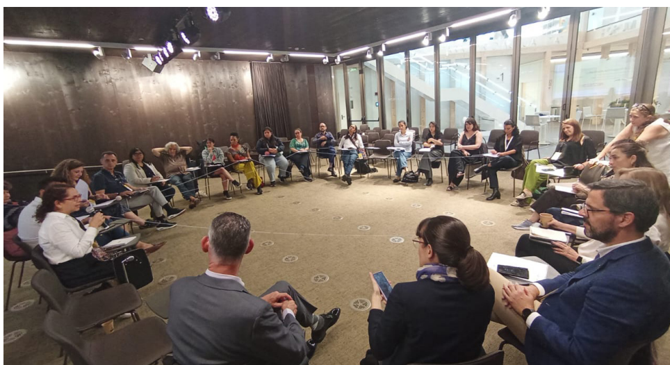
Taller regional: Cartografías afectivas.

➤ Acceda a la transmisión completa del Día 2 dando clic aquí .