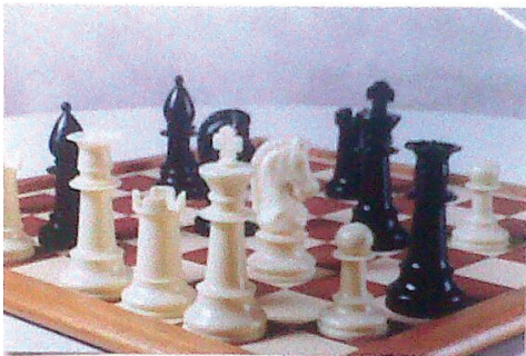
Fotografía utilizada por la denunciada